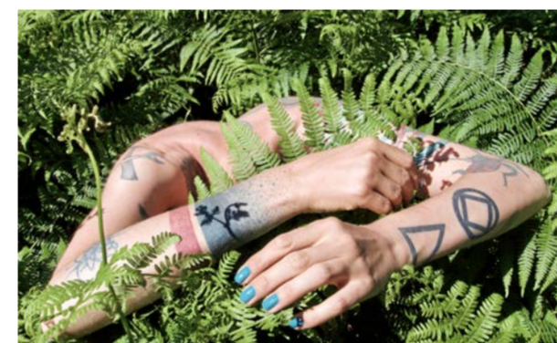
Bracken is my pronoun.