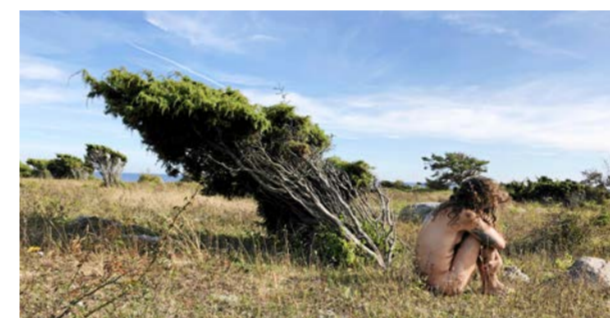
Juniper is my pronoun.