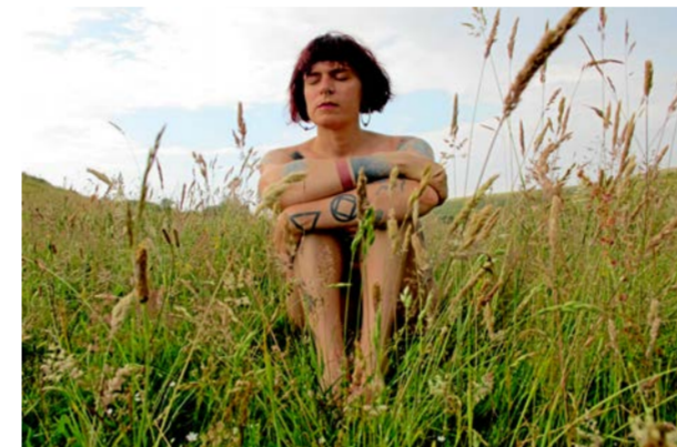
Meadow is my pronoun.