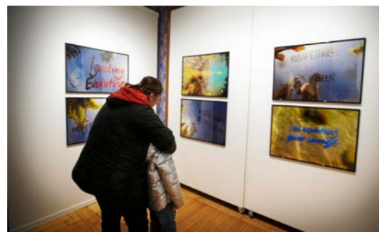
Utställningen på Apotekshuset pågår till 15 januari.